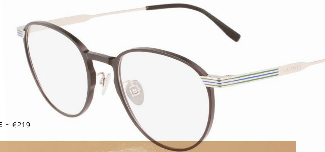
LACOSTE - €219