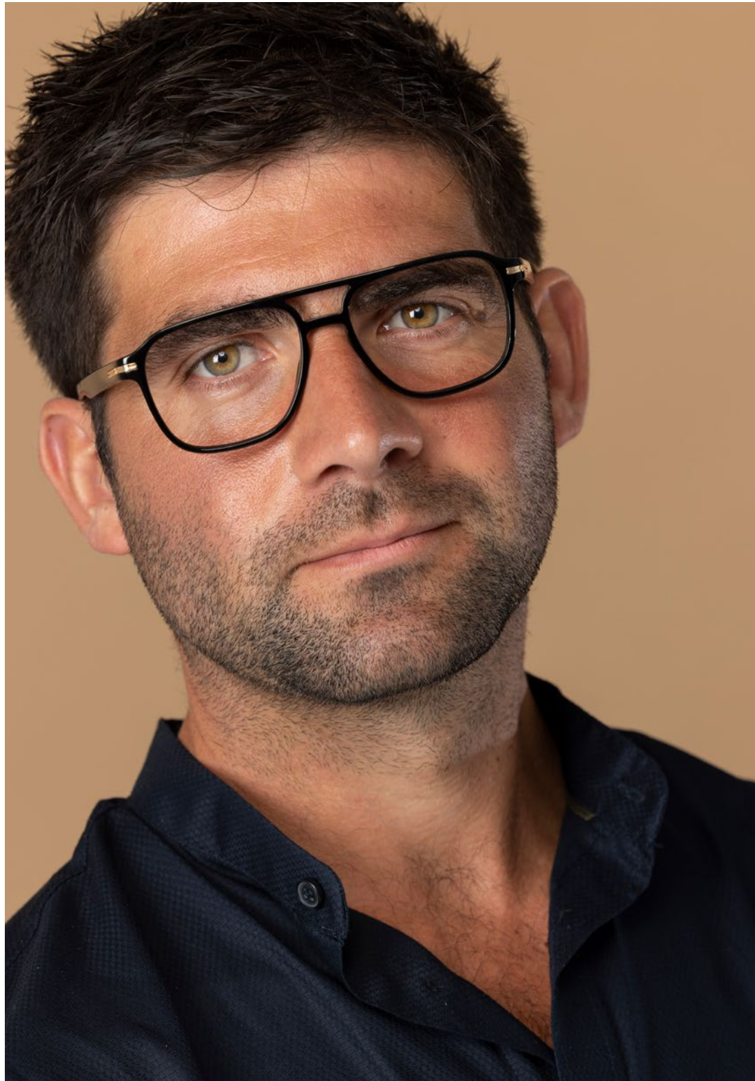
HUGO BOSS - €207