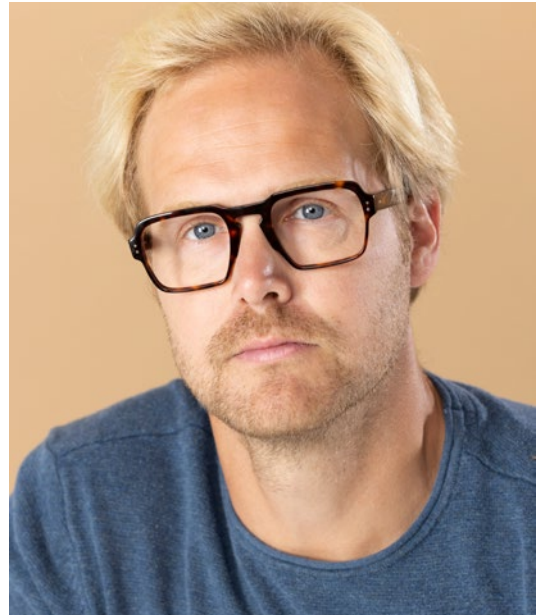
LAFONT - €288