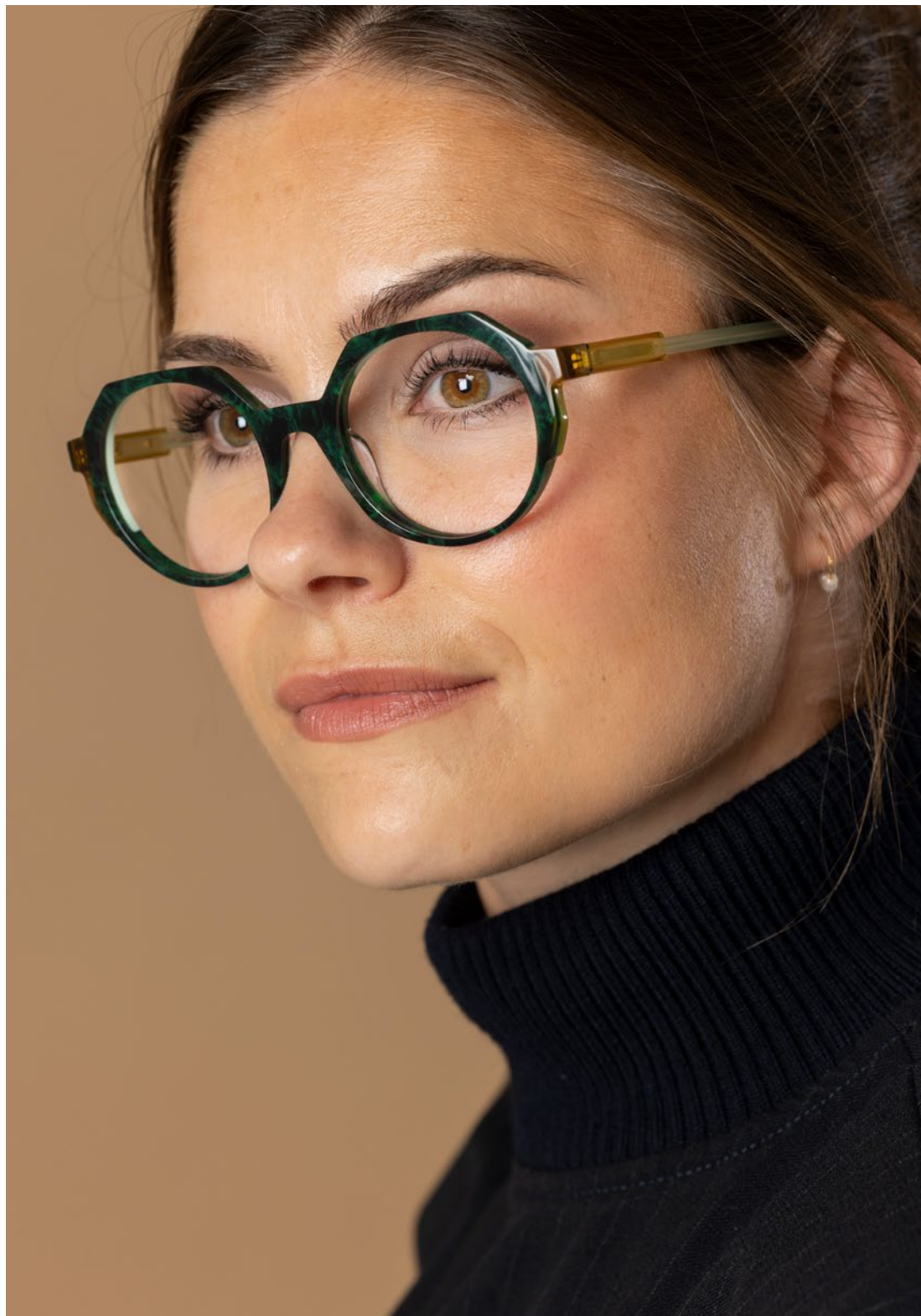
ETNIA BARCELONA - €216