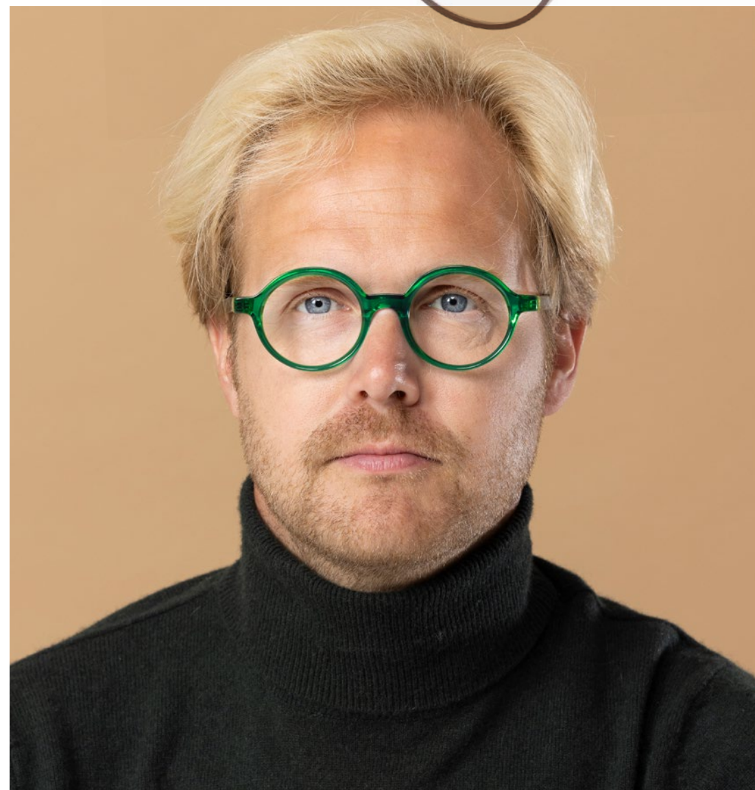
ETNIA BARCELONA - €204