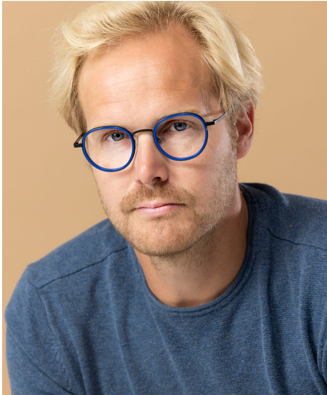
WOOW - €264

everything is pretty simple, just try a different way to watch.