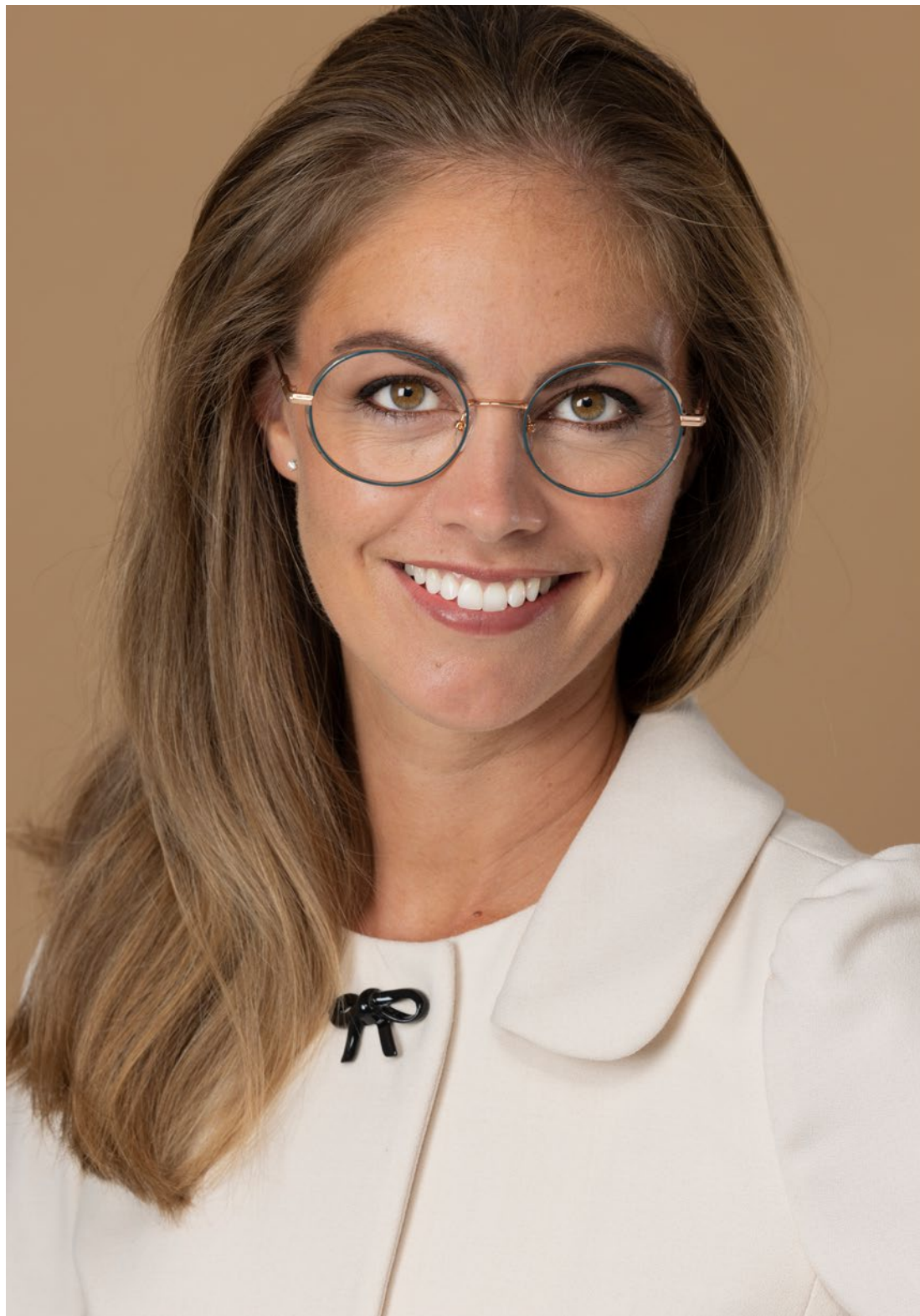
BA&SH - €252