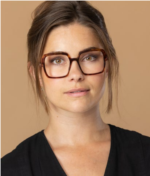
CAROLINE ABRAM - €375

Gistelsteenweg 385C • 8490 Jabbeke • T 050 81 27 36 • W optiekgekiere.be