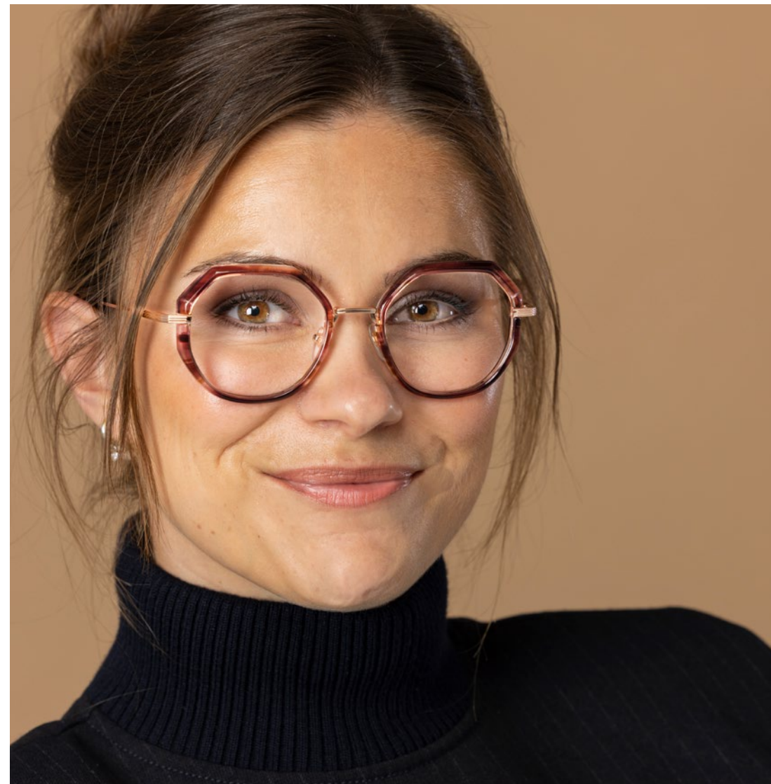
CARVEN - €345